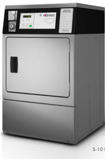
S-10 INOX COIN

ELEKTRONICKÝ MINCOVNÍK ELECTRONIC COIN-TOKEN BOX