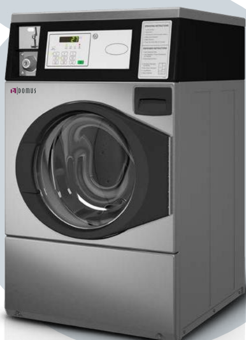
R-10 INOX COIN