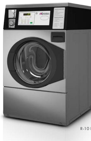
R-10 INOX COIN

ELEKTRONICKÝ MINCOVNÍK ELECTRONIC COIN-TOKEN BOX