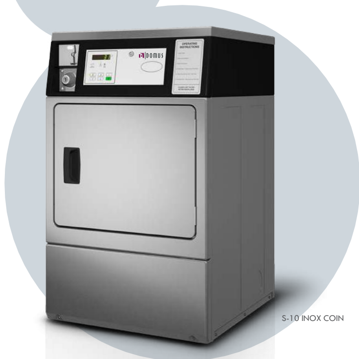
S-10 INOX COIN